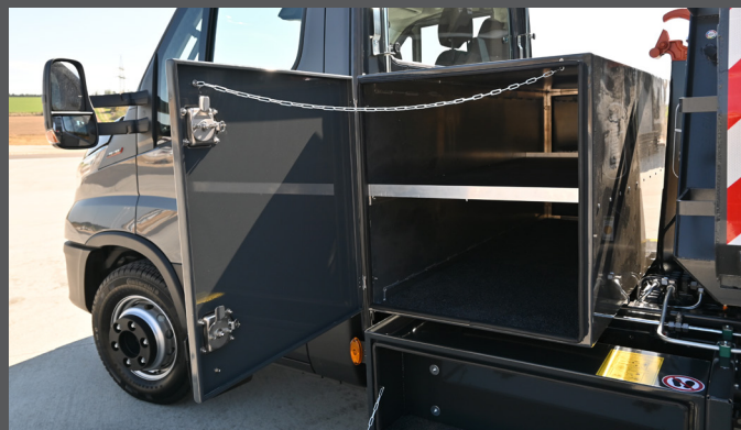
Systemschrank hinter dem Fahrerhaus