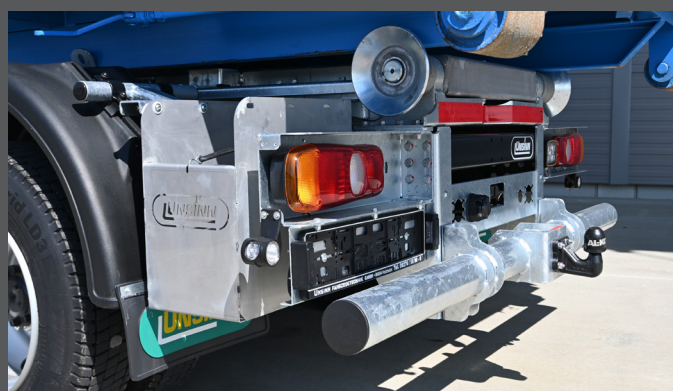
Heckunterfahrerschutz mit Kugelkopfkupplung