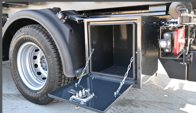
Weitere Werkzeugkisten möglich