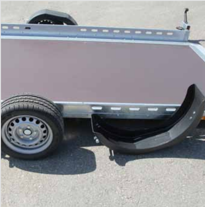
Kotflügel komplett abklappbar