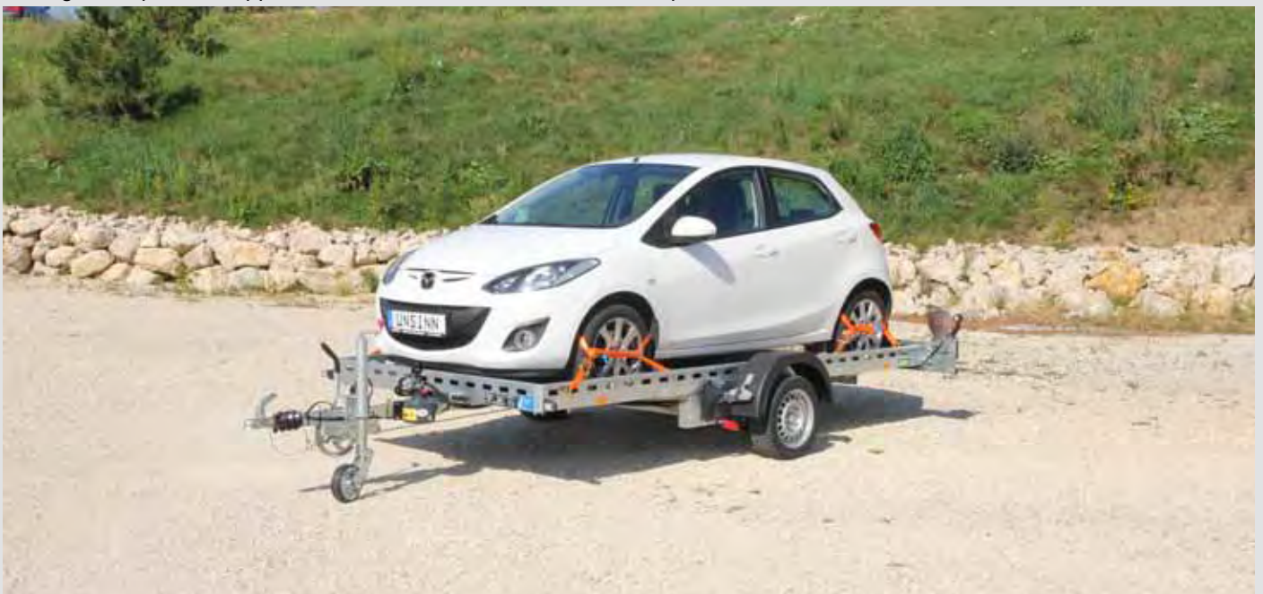
Ideal zum Transport von Kleinwagen