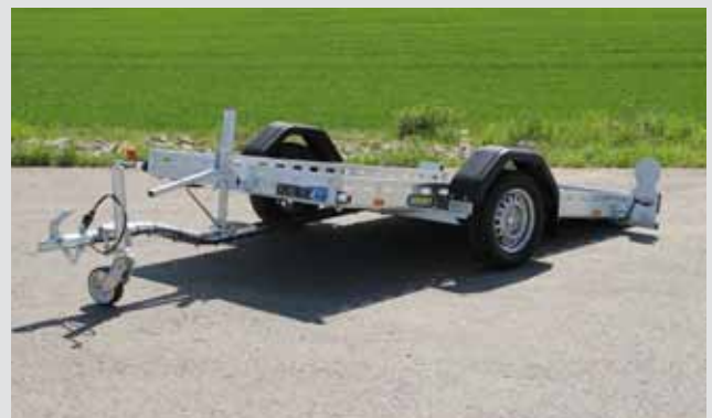
Absenkanhänger ungebremst bis 515 kg Nutzlast