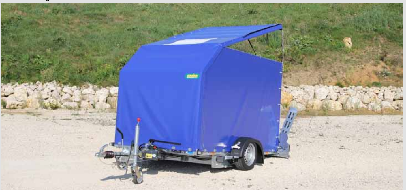
Absenkanhänger mit Planenaufbau