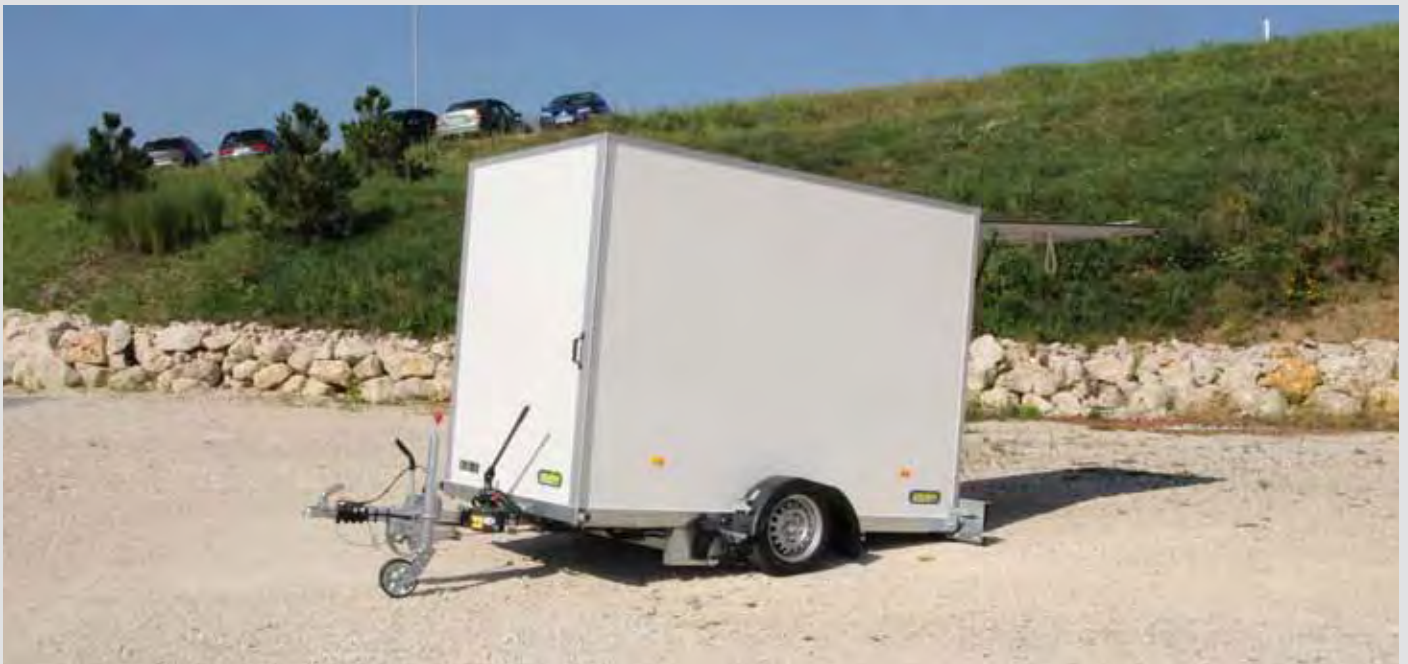
Absenkanhänger mit Kofferaufbau