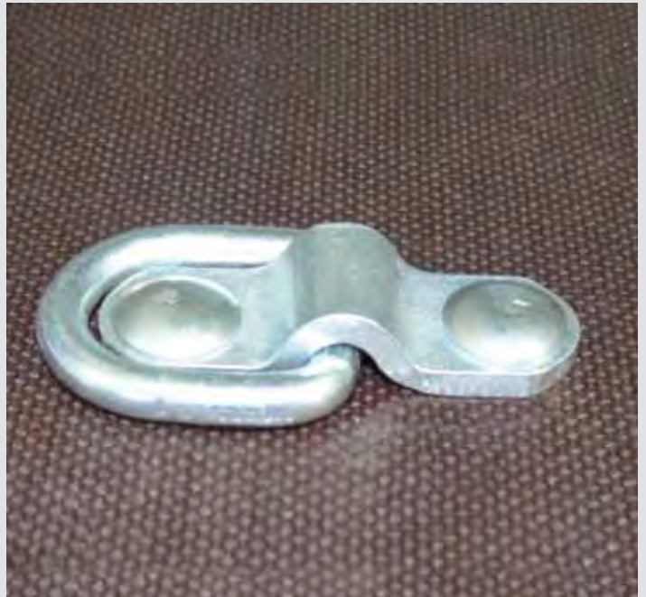
Zurrpunkt auf der Ladefläche