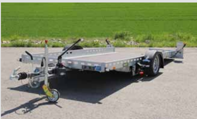
Absenkanhänger für Kleinwagen bis 1325 kg Nutzlast

Leuchten und Kabelführung sind geschützt montiert. Dadurch weniger Wartungskosten und lange Nutzungsdauer.