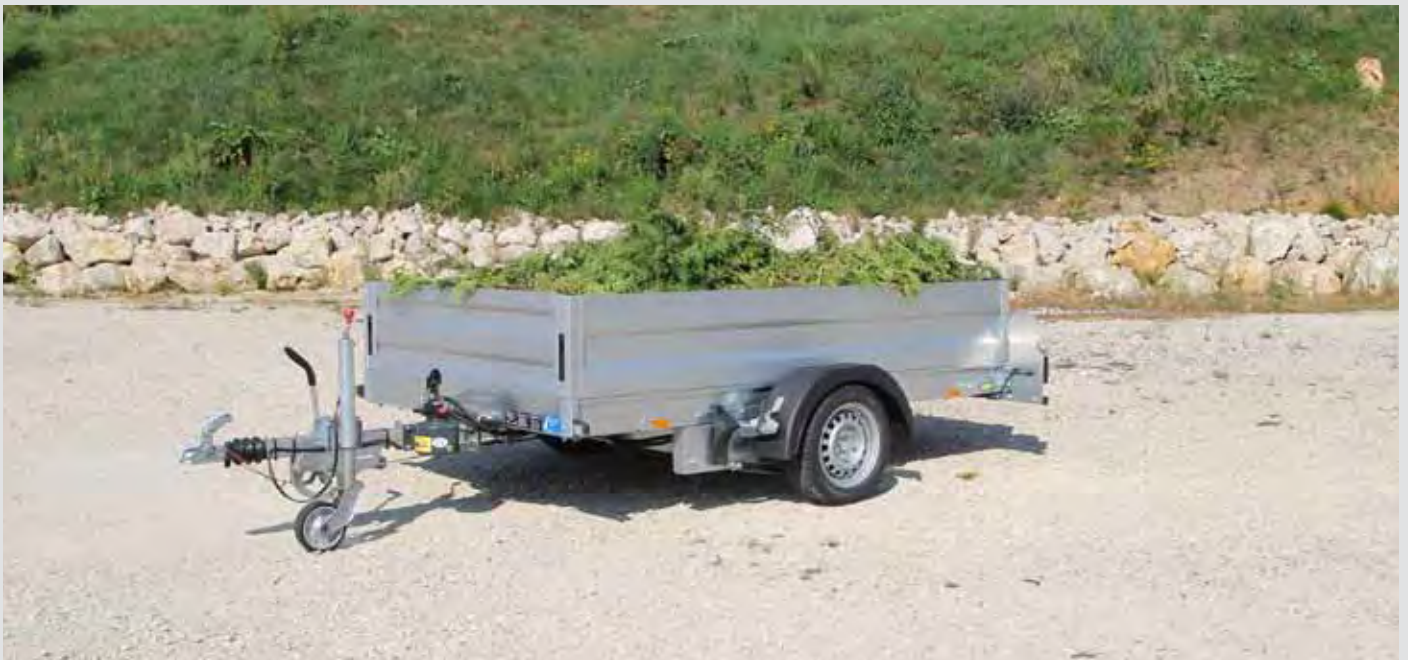
Absenkanhänger mit Bordwänden